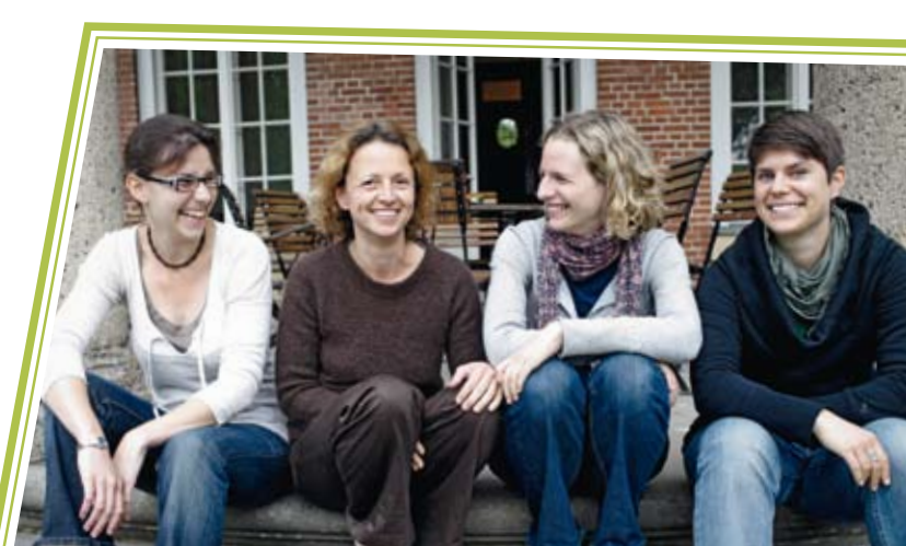
Photo credits front page (l.t.r.) Photo 1: Project encounter in the EUROPEANS FOR PEACE programme | Photo 2: Installing stumbling blocks at Humboldt University in Berlin | Photo 3: Inter-generational dialogue in the PARTNERSHIPS FOR VICTIMS OF NATIONAL SOCIALISM programme. Photos inside: Photos 1,3,4: Project advisory seminar in the EUROPEANS FOR PEACE programme | Photo 2: Project work in the EUROPEANS FOR PEACE programme

luebge@stiftung-evz.de www.europeans-for-peace.de